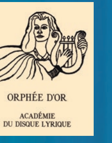
ZŁOTY ORFEUSZ PARYŻ 2015