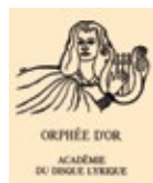
ZŁOTY ORFEUSZ PARYŻ 2015