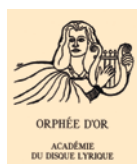
ZŁOTY ORFEUSZ PARYŻ 2015