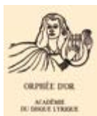
ZŁOTY ORFEUSZ PARYŻ 2015