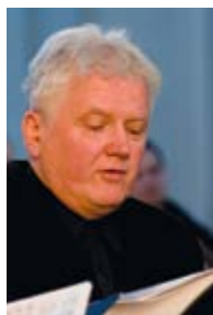
Marcin Bornus- -Szczyński – tenor